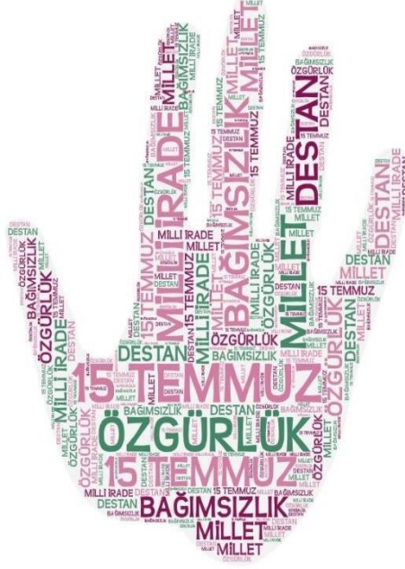
4/C Sınıfı Öğrencileri..